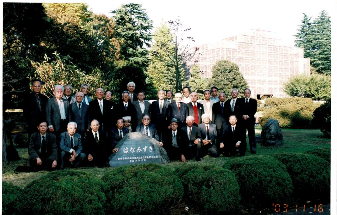
如水会井の頭支部 創立50周年記念植樹（国立キャンパス）前にて